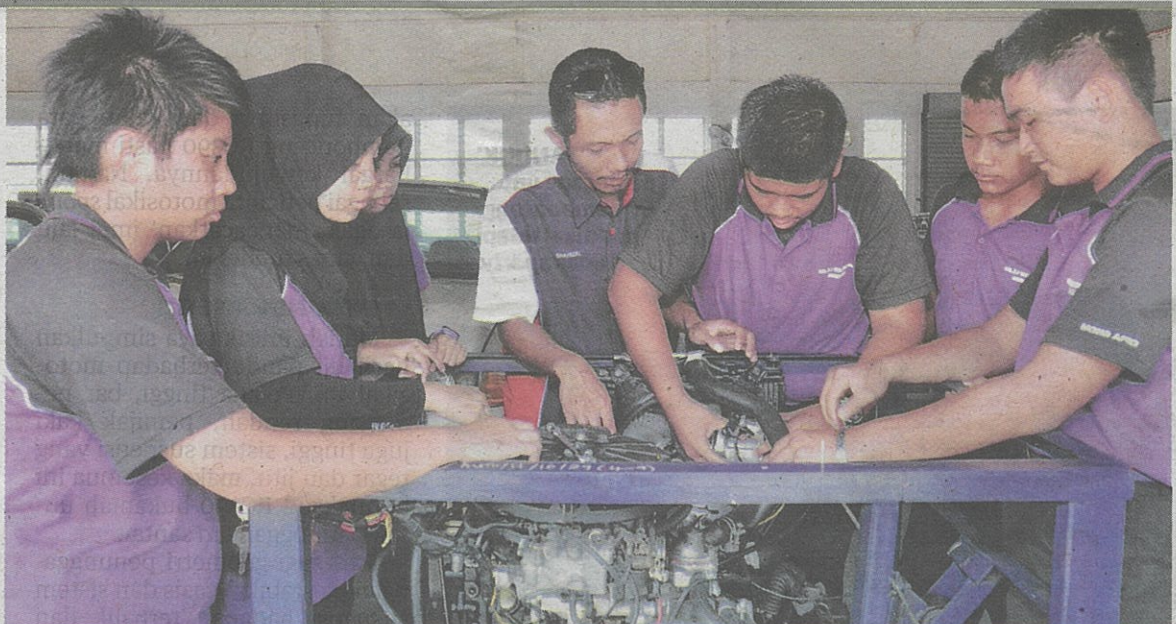
PROGRAM TVET membolehkan pelajar mendalami ilmu kemahiran yang diperlukan oleh industri. - GAMBAR HIASAN